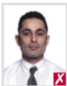
โกเลเกินไป