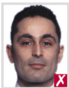
โกเลเกินไป